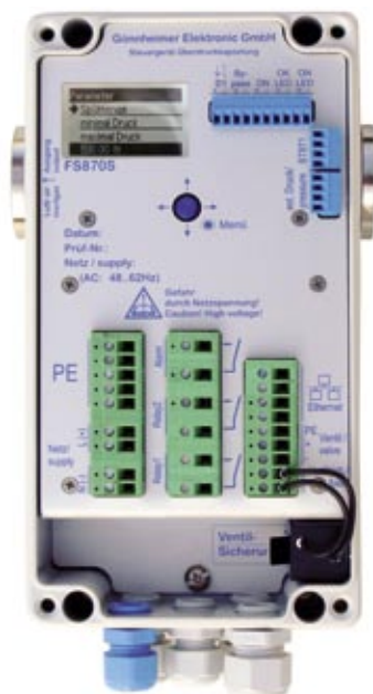
Spülcontroller für die Ex-Zone 1

deutlich reduzierten Strömungswiderstand auch einen größeren Dynamikbereich der Durchflussmessung. Somit ist es möglich, einen sehr großen Durchflussmessbereich für unterschiedlichste Applikationen ohne Veränderung der Hardware abzudecken. Des Weiteren wurde das passive, mechanische Auslassventil durch ein aktives, proportional arbeitendes Ventil ersetzt, das, ebenso wie das proportionale Spülgas-Einlassventil, durch die Ex-p-Stuereinheit angesteuert wird.